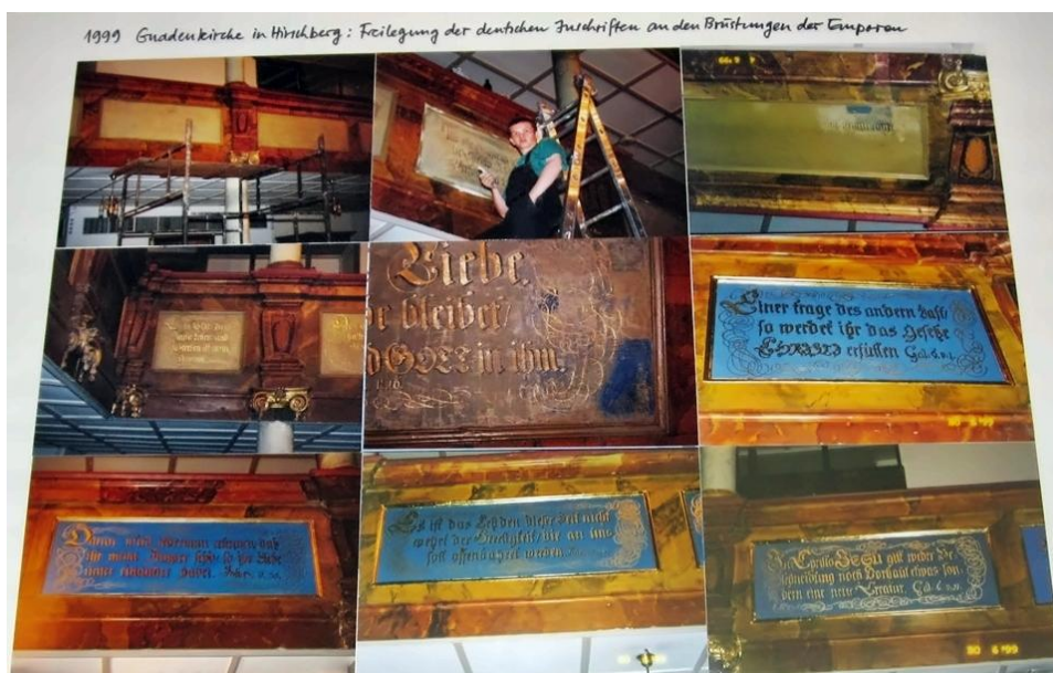
Renowacja inskrypcji biblijnych na emporach

Aby umożliwić dzisiejszym obecnym Ślązakom w Jeleniej Górze odczytanie tych napisów, teksty zostały przetłumaczone na język polski. Niech w przyszłości myśl i uczucia chrześcijańskie będą nadal na pierwszym planie a przyszłe pokolenia niech czytając cytaty biblijne zastanowią się nad podstawowymi wartościami chrześcijańskimi i czerpią z nich siłę.