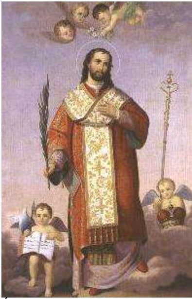
Św. Jozafat Kuncewicz obraz z XIX w. Warszawa cerkiew Bazylianów

Jan Kuncewicz urodził się w 1580 roku we Włodzimierzu Wołyńskim. Pochodził z rodziny mieszczańskiej. Wysłany do Wilna, aby przysposobił się do zawodu kupieckiego, zetknął się tam ze sprawą unii. W 1604 roku przyjął habit bazylikański oraz imię Jozafat. W pięć lat później po studiach teologicznych został kapłanem. W wieku 38 lat został arcybiskupem unickim w Połocku, gdzie podjął pracę bardziej misjonarza niż pasterza. Będąc biskupem nadal prowadził życie skromne i surowe. Swoje jednoizbowe mieszkanie dzielił z bezdomnym. Jego działalność budziła niezadowolenie przeciwników unii z Kościołem Rzymskim. Po powrocie z sejmku w Warszawie (1621) doszło nawet do zamieszek i tumultów prawosławnej ludności. Kiedy wyszedł do tłumu demonstrującego przed jego mieszkaniem w Witebsku 12 listopada 1623 roku, został napadnięty i zabity. Sponiewierane ciało Świętego utopiono w Dźwinie.