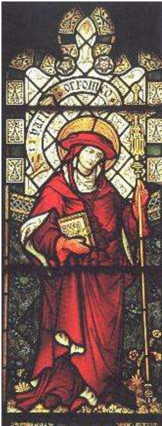
Sw. Karol Boromeusz witraż z XIX w. Oxford

Św. Karol Boromeusz urodził się na zamku Arona w 1538 roku jako syn arystokratycznego rodu. Studia ukończył na uniwersytecie w Pawii, uzyskując doktorat obojga praw (1559). Znałca sztuki. Grał pięknie na wiolonczeli. W 23 roku życia mianowany kardynałem i arcybiskupem Mediolanu. Świecenia kapłańskie i biskupie przyjął dopiero dwa lata później. Po niespodziewanej śmierci brata, która była dla niego duchowym wstrząsem, podjął życie pełne pobożności i ascezy. Współpracując ze swoim wujem, papieżem Piusem IV doprowadził do końca Sobór Trydencki. Uchwały tego soboru wprowadził w swej diecezji. Założył pierwsze seminarium duchowne. Hojny dla ubogich, żył ubogo. Podczas zarazy w Mediolanie (1576) niósł pomoc chorym, oddał wszystko, nawet własne łóżko.