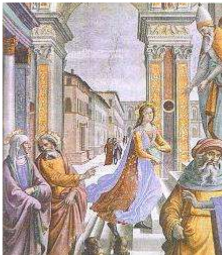
Domenico Ghirlandaio, Ofiarowanie Maryi w świątyni

św. Kolumbana op. (+ 615) św. Rufusa (+ I w.)